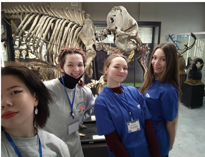
Рисунок 1. Волонтеры ФГБОУ ВО СПбГУВМ работают на экскурсии в день открытых дверей

Событийное направление работы позволяет студентам участвовать в жизни университета, помогая на внутренних мероприятиях (праздниках, конференциях и пр.), что дает возможность студентам общаться с преподавателями с другой позиции (помощника, а не обучающегося) и дает опыт организации мероприятий различного уровня, т.к. зачастую студент видит организацию конференций и других мероприятий «изнутри», например, при проведении организованных экскурсий по университету, рис. 1.