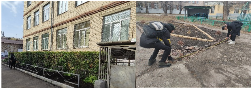
Фото 3, 4. Подготовка клумб к посадке (внесение чернозема), измерение