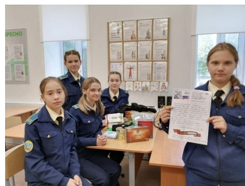
Фото 4. Письмо солдату

Проведении акции «Чистый памятник» (фото 5,6).