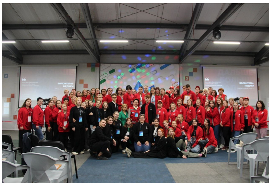
Рис. 1. Участники, руководители и организаторы Свердловского областного форума волонтеров-медиков.

С 20 по 22 сентября 2024 года в Свердловской области проходил областной форум волонтеров-медиков «Дальше – больше! Дальше – круче!». В течение трех насыщенных дней каждый участник и организатор форума обменивался опытом и знаниями, связанные с оказанием первой помощи, профилактикой деменции и санитарно-профилактическом просвещении.