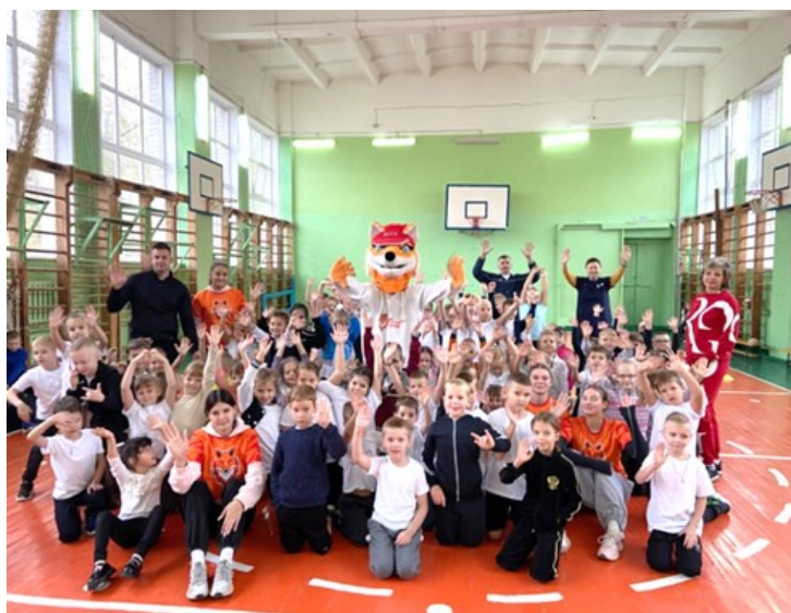
Рис. 1. Спортивный праздник для учащихся МБОУ СОШ №53 г. Брянска

Одним из основных направлений волонтерской деятельности ЦДИ «БГУОР» ССК «Огненный Лис» является событийное волонтерство, которое связано с организацией и проведением спортивных праздников (рис.1) и мероприятий для различного контингента, начиная с воспитанников дошкольных образовательных организаций, общеобразовательных школ, ССУЗов, школ –интернатов, центров развития и реабилитации лиц с ограниченными возможностями здоровья, интернатов для престарелых людей.