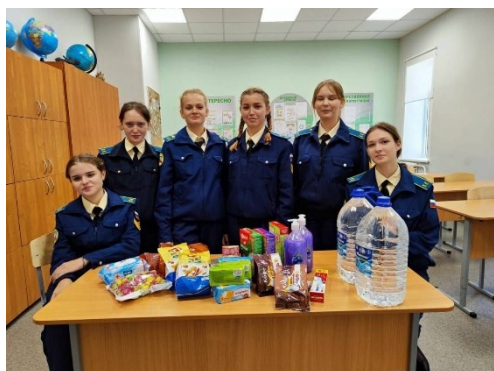
Фото 3. Посылка солдату

Проведение и участие в социальных акциях «Письмо и посылка солдату» (фото 3,4).