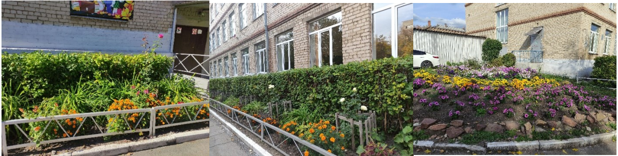
Фото 5-7. Вот такие клумбы были в нашей школе в сентябре 2024 года

Проект «РасЦвети, школа!» не только помог сделать территорию МОУ «С(К)ОШИ № 4» г. Магнитогорска более зелёной и красивой, но и научил детей заботиться о природе и бережно относиться к ней. С этим проектом эковолонтеры выступили на двух городских конкурсах: защищали проектную идею в конкурсе по социальному проектированию «Активное пространство», а уже в конкурсе на «Лучший добровольческий проект» представили итоги реализации и стали победителями.