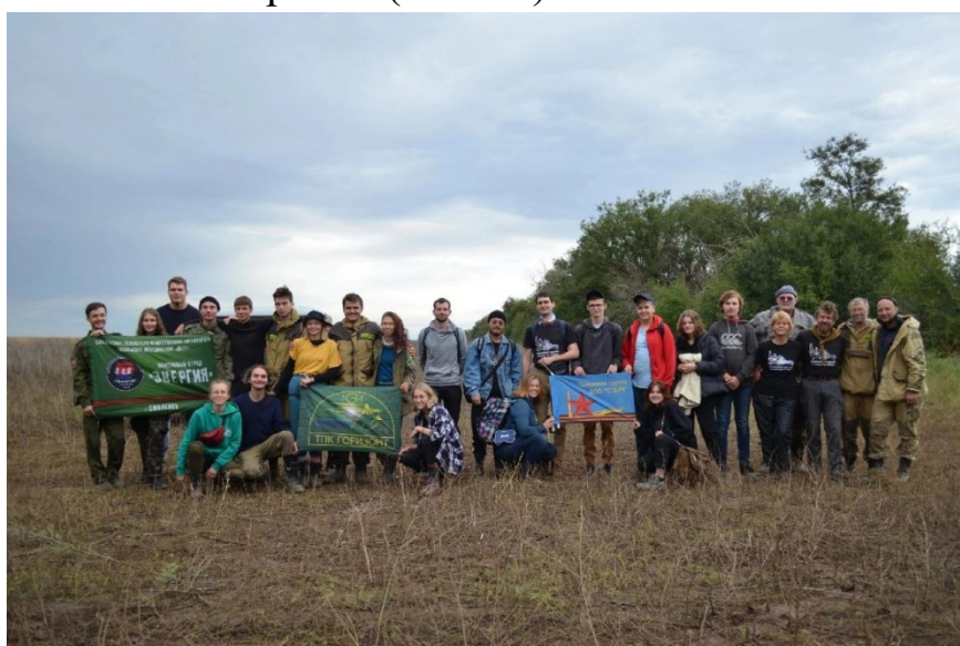
Фото 2. Слет поисковых отрядов НИУ «МЭИ»

В сентябре 2022 года «Сталинградский рубеж» провел Первый слет поисковых отрядов НИУ «МЭИ» в честь 80-летия Победы советских войск в Сталинградской битве. Представители трех отрядов – «Сталинградский рубеж» (филиал НИУ «МЭИ» в г. Волжском), туристического-поисковый клуб «Горизонт» (НИУ «МЭИ» в г. Москве), «Энергия» (филиал НИУ «МЭИ» в г. Смоленске) – встретились в Волжском филиале для совместной экспедиции. Слет проходил на территории Карповского, Вертячинского и Россошинского сельских поселений Городищенского района Волгоградской области. Работы велись в местах обороны 98-й стрелковой дивизии и в полосе наступления 65-й армии. (Фото 2)