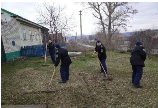
Фото 1. Помощь ветерану ВОВ

На протяжении нескольких лет в нашей школе действует волонтерское движение «Рука помощи», в которое входят учащиеся 5-11 классов. Ежедневно кадеты принимают участие в значимых мероприятиях: «Помощь ветеранам Великой Отечественной войны и ветеранам педагогического труда». (фото 1,2)