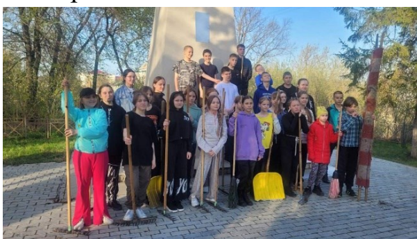
Фото 5. Чистый памятник

Проведении акции «Чистый памятник» (фото 5,6).