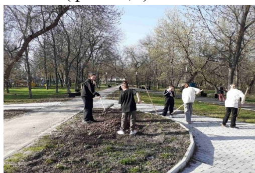
Фото 6. Чистый памятник

Волонтерская деятельность для школьника – это возможность быть вовлеченными в общество и влиять на это общество. Она может иметь различные формы: помощь бездомным животным, участникам ВОВ, ветеранам педагогического труда, участникам СВО. Вовлечение учащихся в волонтерское движение помогает им почувствовать себя неотъемлемой частью целостного государства, а соответственно и важной частью патриотического волонтерства школьников.