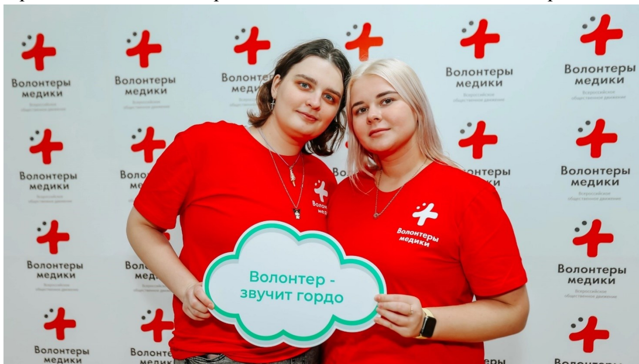
Рисунок 1 – Волонтер звучит гордо

«Доброволец года Владимирской области», диплом в номинации «Твори добро» за личный вклад в развитие молодежных общественных организаций.