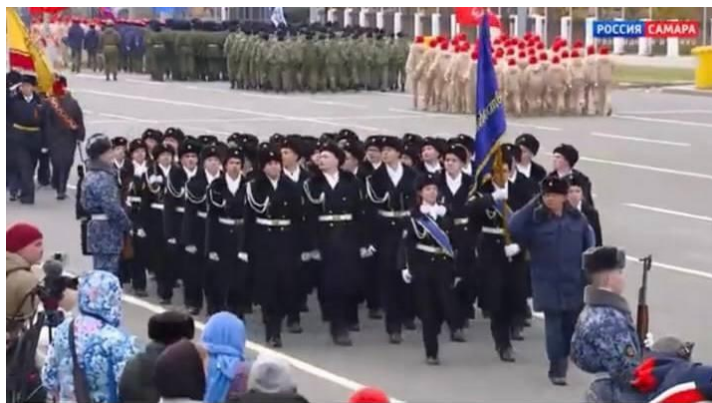
Рис. 1. Торжественный марш кадет на Параде Памяти в Самаре.

Следует отметить, что в тот же день, 7 ноября, кадеты 7-8 классов парадным строем проходят по площади 30-летия Победы в р.п. Карсун, выстраиваются в почетном карауле у Памятника Родина-мать, равняясь на бессмертный подвиг своих дедов и прадедов (Рис. 2).