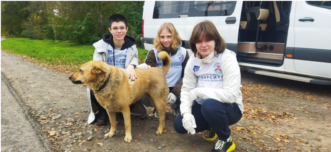
Рисунок 2. Волонтеры перед работой в центре реабилитации для диких животных «Велес»

Таким образом, волонтерство в ФГБОУ ВО СПбГУВМ является необходимой составляющей частью воспитания студентов, помогает им приобретать социальные навыки, опыт и знакомства.