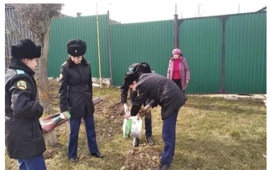
Фото 2. Помощь ветерану педагогического труда