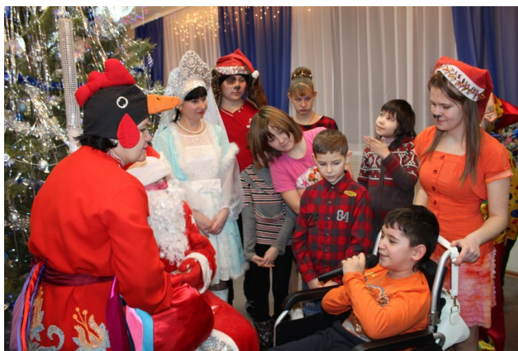
Новогоднее представление: “В гостях у семьи Барбоскиных”, 2018 г.

Социальное волонтерство играет важную роль в жизни детей с ОВЗ, предоставляя им возможность общаться, развиваться и жить полноценной жизнью. Присоединяйтесь к волонтерскому движению - сделайте вклад в будущее детей с ОВЗ!