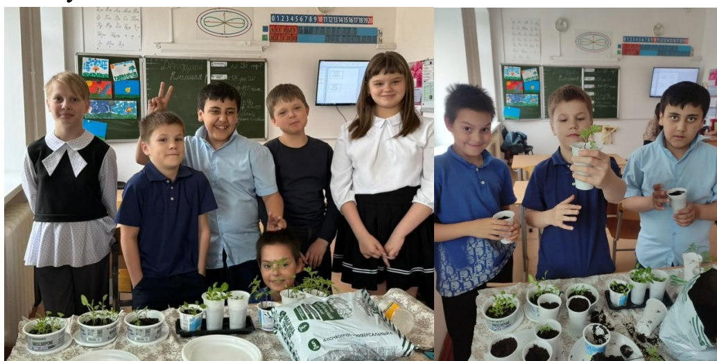
Фото 1, 2. Школьники 4 «а» занимаются пикировкой рассады

Самым интересным было наблюдать, как младшие школьники увлечённо занимаются выращиванием растений. Они с большим энтузиазмом ухаживали за рассадой, поливали её и следили за тем, чтобы растения получали достаточно света и тепла.