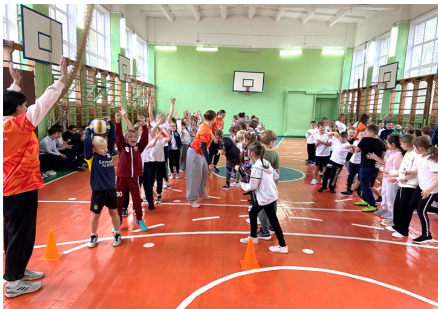
Рис.2. Совместная работа волонтеров и учеников во время праздника

Основная задача руководителей волонтерского движения училища, развитие у студентов-волонтеров не только способностей к сопереживанию и заботе, но и формирование новых взглядов на необходимость большего взаимодействия, с каждым, кто готов присоединиться к активной физкультурной деятельности.